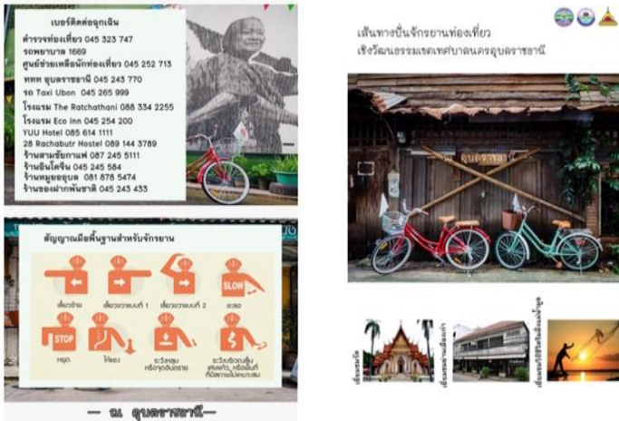
ภาพที่ 2 แสดงรายละเอียดด้านนอกแผ่นพับ