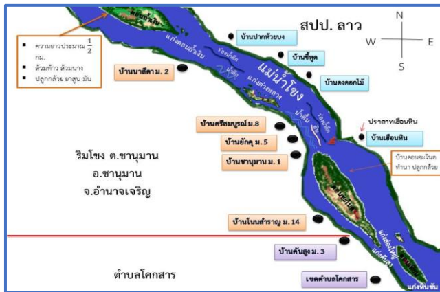
แผนที่ 2 แสดงระบบนิเวศแม่น้ำโขงบริเวณชุมชน

โขงตลอดแนว มีแหล่งท่องเที่ยวตามธรรมชาติที่สวยงาม เช่น แก่งต่างหล่าง ซึ่งสามารถพัฒนาให้เป็นแหล่งท่องเที่ยวได้ เนื่องจากมีจุดจอดเรืออยู่ใกล้ตลาดสดมิตรภาพ ไทย - ลาว ทั้งยังมีกลุ่มอาชีพต่าง ๆ เช่น กลุ่มข้าวหอมมะลิ กลุ่มเกษตรอินทรีย์ กลุ่มปุ๋ยอินทรีย์ กลุ่มจักสาน และยังได้รับรางวัลกองทุนหมู่บ้านดีเยี่ยม นอกจากนี้ บ้านศรีสมบุญมีภูมิปัญญาท้องถิ่น มีกลุ่มชมรมอนุรักษ์กอลองกิ่ง การทำเครื่องจักสานใช้สำหรับในครัวเรือน ตลอดจนภูมิปัญญาการจับปลาตามธรรมชาติ มีสินค้าขึ้นชื่อคือปลาข้าวต้มแม่ น้ำโขง