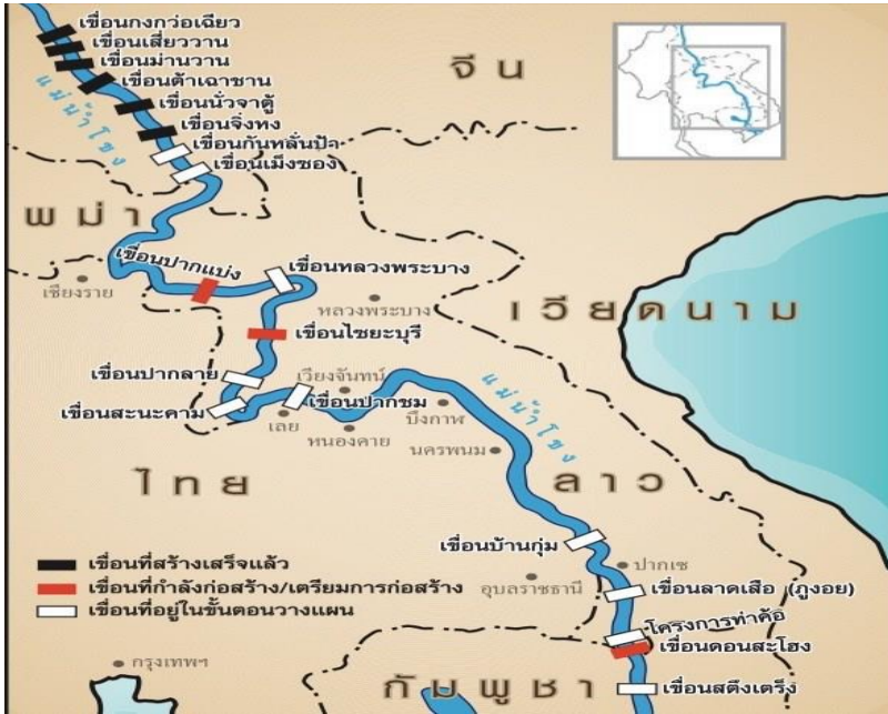
แผนที่ 1 แสดงเขื่อนตามลำน้ำโขงสายหลัก แผนที่แสดงเขื่อนในลำน้ำโขง (เครือข่ายประชาชนไทย 8 จังหวัดแม่น้ำโขง, 2562)

สร้างเขื่อนในลำน้ำโขงตอนบนและประเทศลาวที่ต้องการหลุดพ้นจากความยากจนก็ได้มีแผนสร้างเขื่อนในแม่น้ำโขงในส่วนที่ไหลผ่านประเทศลาว