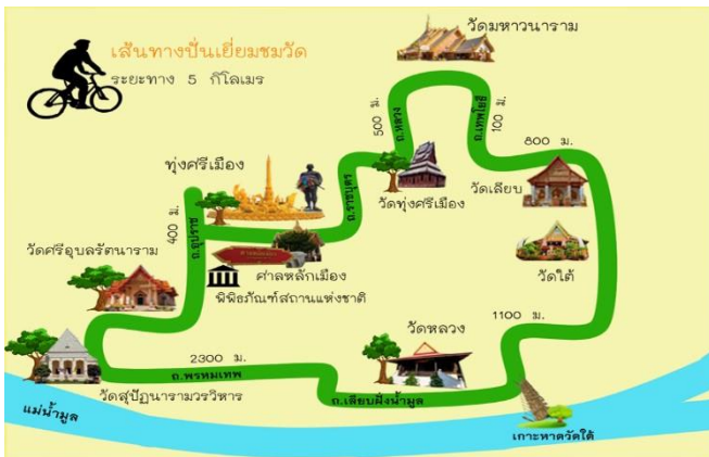
ภาพที่ 1 เส้นทางปั่นจักรยานท่องเที่ยวในเขตพื้นที่เทศบาลนครอุบลราชธานี

ประชาสัมพันธ์ที่ผ่านมายังไม่มีสื่อที่หลากหลายและยังไม่สามารถเข้าถึงนักท่องเที่ยวได้อย่างแท้จริง