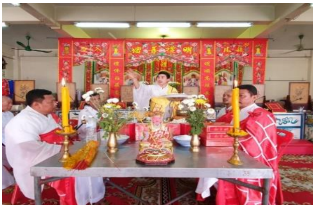
ภาพที่ 4 ภาพพิธีปักเทียนเข้าของทางมูลนิธิสว่างจรรยาธรรมสถาน จังหวัดบุรีรัมย์