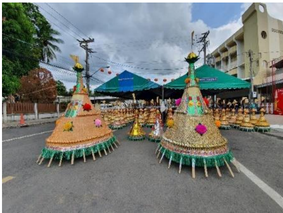
ภาพที่ 1 ภาพกิมข้าวลูกใหญ่และเล็กของทางมูลนิธิสว่างจรรยาธรรมสถาน จังหวัดบุรีรัมย์