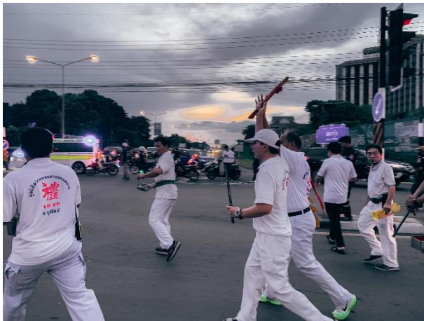
ภาพที่ 2 ภาพพิธีเชิฐดวงวิญญานไร่ญาติของทางมูลนิธิสว่างจรรยาธรรมสถาน จังหวัดบุรีรัมย์